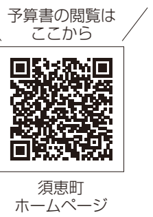
須恵町ホームページ