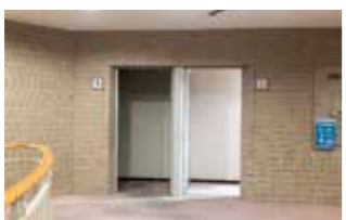
トイレには人感センサーを