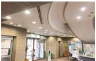
玄関入ってすぐのロビー

アザレアホール共用部の照明器具をLEDに取り替えます。 この工事は、平成30年度から計画的に実施しており、今年度はエントランスや会議室およびトイレを改修します。 トイレは、避難所開設時も町民の方が利用しやすいよう、人感センサーの設置を計画しています。