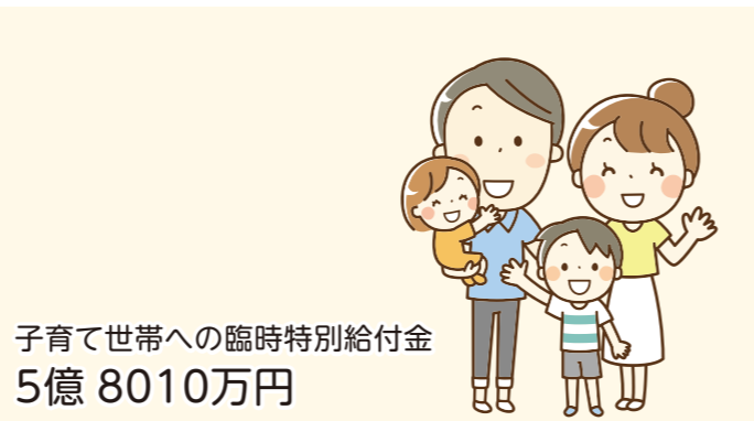
子育て世帯への臨時特別給付金 5億8010万円