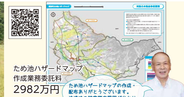
ため池ハザードマップ 作成業務委託料 2982万円

ため池ハザードマップの作成・配布ありがとうございます。決壊時の被害想定範囲が分かり、避難の参考になります。農区においても、ため池の管理をきちんとしていきたいと思います。