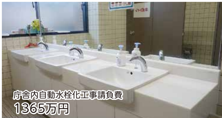
庁舎内自動水栓化工事請負費 1365万円