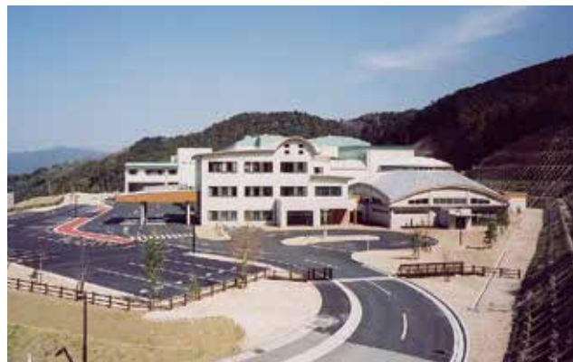
須恵町外二ヶ町清掃施設組合 「クリーンパークわかすぎ」