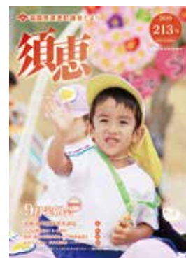
須恵町議会だより