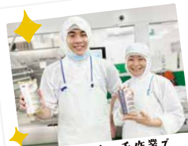
魚の骨も全て手作業で取り除いているそうです。

現状に満足することなく、これからも味を追求し、おいしい押し寿司をたくさんの人に届けたいと熱く語っていただきました。