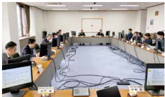
志免町議会と意見交換

査を充実させていくために議論を深めていく。②議会報告会など、須恵町議会が行っていない取組みについての協議。③議会基本条例の制定に向けては、委員会協議を重ねるとともに、すでに条例を制定している議会への視察も検討しています。須恵町議会独自の基本条例制定に向けて、取り組んでまいります。