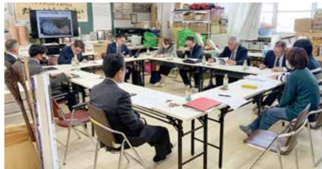
いきいきコミュニティ事務局を訪問

地域の協力なしには成り立ちませんが、関わる方が高齢化しているのも事実です。今後、幅広く町民に参加を促し、地域の強みを生かした独自のコミュニティを作り上げていけるよう議会としても支援してまいります。