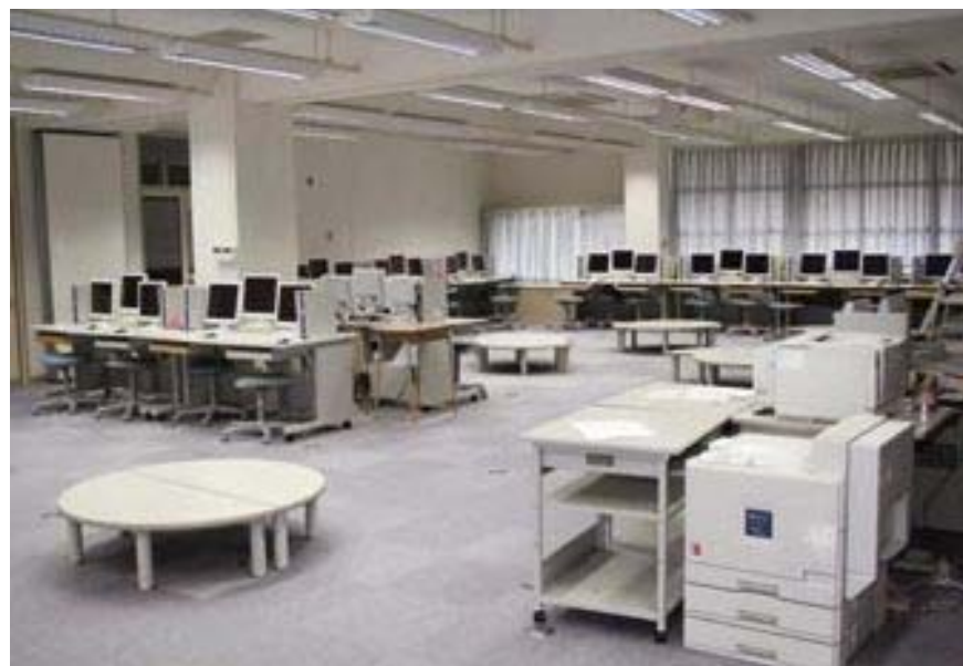
パソコン教室 (須恵中学校)