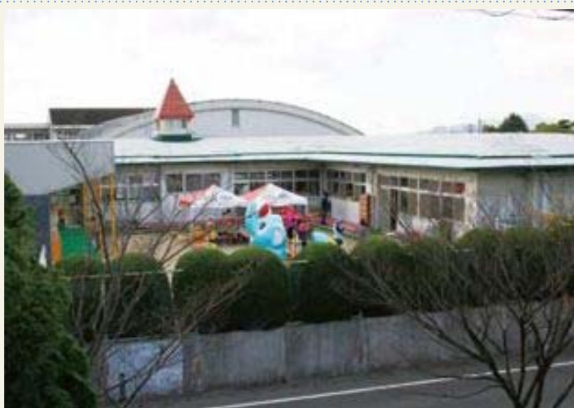
屋根の防水改修工事が行われるアザレア幼稚園(にこにこルーム)