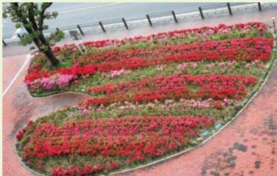
町の花「ツツジ」(庁舎玄関前)

たどり、信頼を失いかけています。 来る7月の参議院議員選挙では、おのずとその真価が問われるところですので、我々の日本は、どうなるのでしょうか。