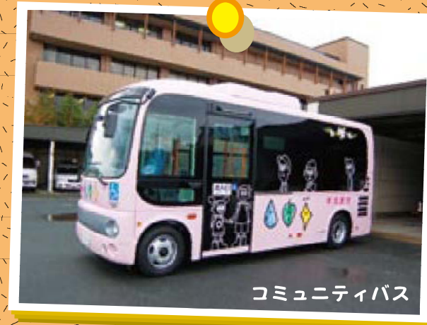
コミュニティバス