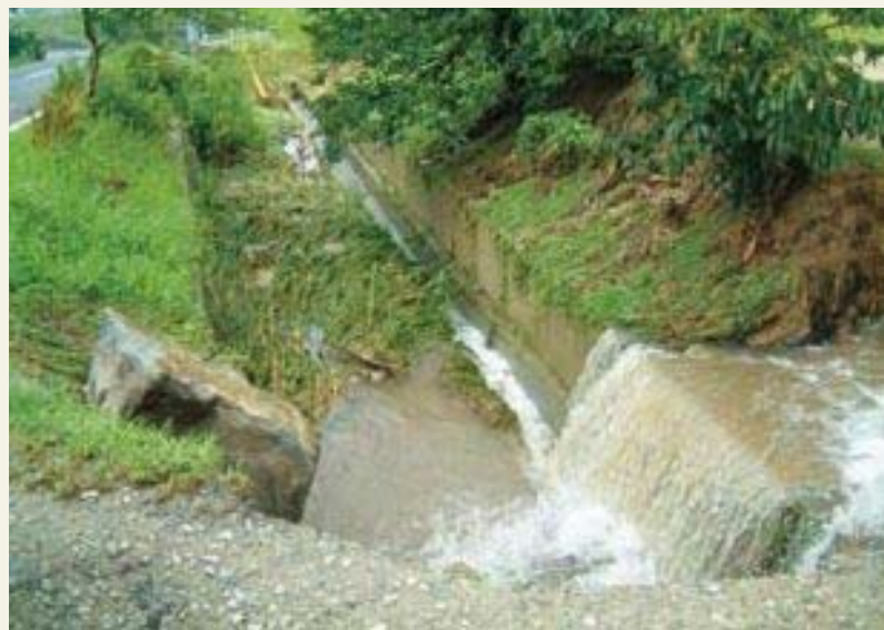
災害日翌日の「上川原水路」 (上須恵：高宮～東原線)