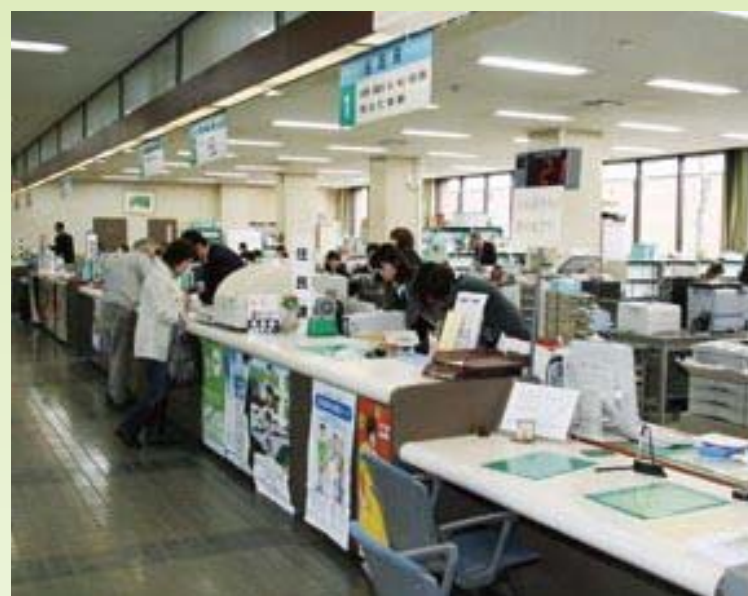
住民票等を交付している 庁舎住民課窓口

セブンイレブンは、東京都渋谷区・三鷹市・千葉県市川市の7店舗で、住基カードと端末を使って住民票の写しと印鑑登録証明書の交付を受けられるサービスをはじめました。 6時半～23時半、日曜日・祝日もサービスが受けられ、住民にとって非常に便利です。 自治体に参加を呼びかけ、5月中旬に国内全店に拡大する予定です。 現在、須恵町で住基カードを持つ人は497人です。