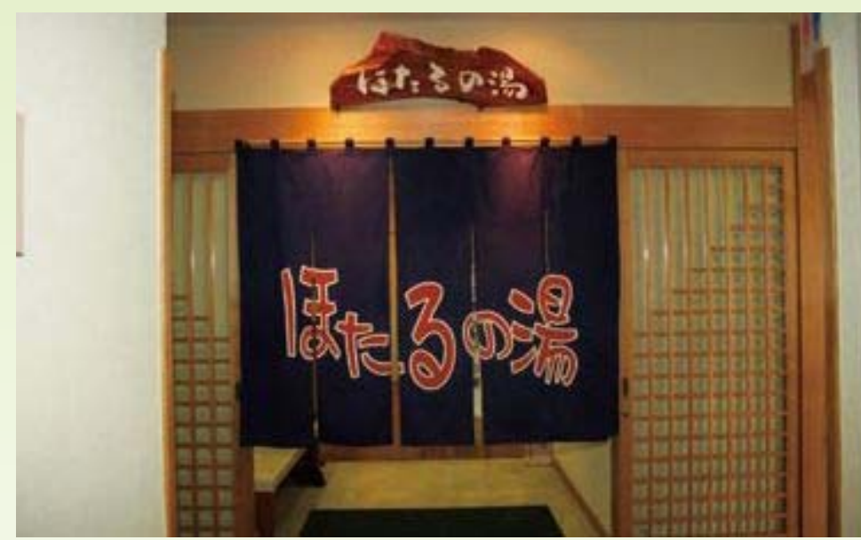
福祉センター内「ほたるの湯」

入浴者が減っているのは、値上げだけではなく、サウナの廃止、新型インフルエンザの流行、コミニティバスの運行時間等が影響していると思われる。 今後は、福祉センターをコミニティの場として、一日を楽しんで帰られるような方向に持っていきたいと思います。