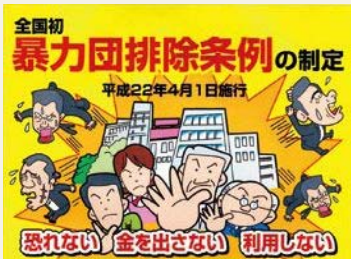
「福岡県暴力団排除条例制定チラシ」より引用