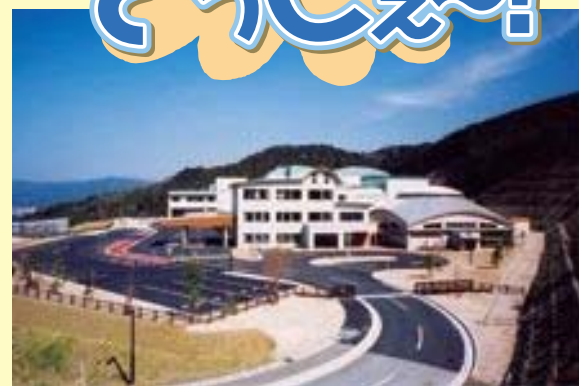
クリーンパークわかすぎ