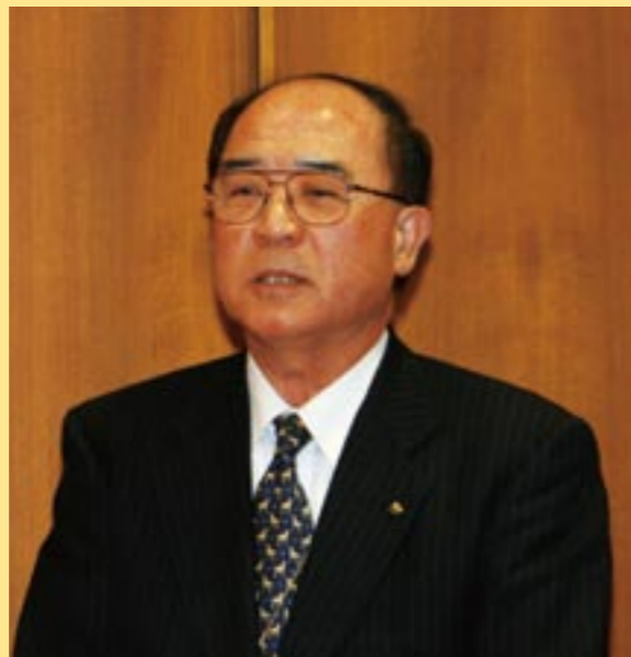
退任の挨拶をされる 庄野副町長