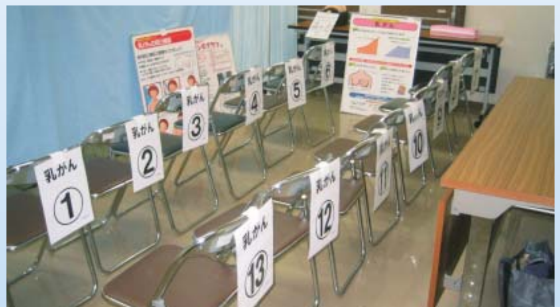
住民健診（乳がん健診）実施会場

子宮頸がん・乳がん検診の無料クーポン券の配布は、厚生労働省から福岡県に通達がないので、具体的な内容が分った時点で、福岡県から報告があると思われます。