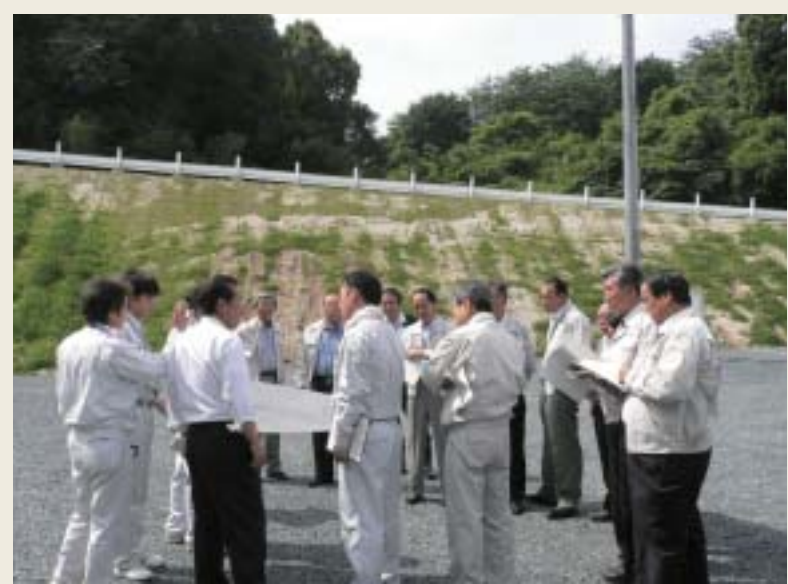
内原～大谷線道路改良工事 現場確認を行う議員団

工事は、工事長1110mで、予算額1176万7000円です。 は、事故が多発した、高速道路の高架下を基点に粕屋町方面とクリーンパーク方面の舗装修繕工事です。 須恵中央駅前広場整備工事は、コミュニケーションバスの発着場を整備するものです。 工事長117.9m、予算額1700万円です。 (全員賛成で可決)