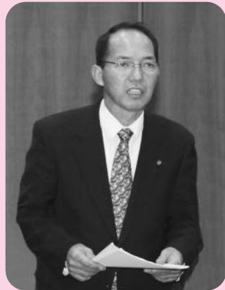
柴田 真人 議員