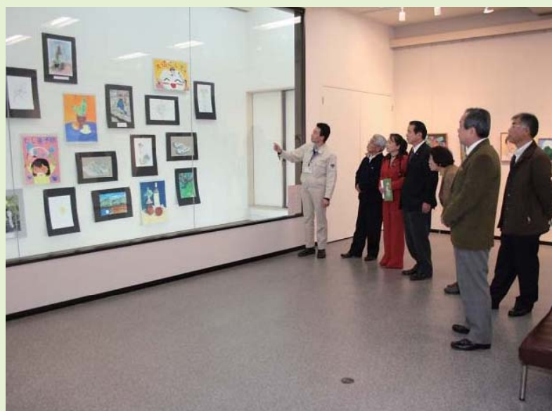
須恵中・須恵東中美術部による初めての合同作品展『須恵の若いアーティスト展』が開催されていました。

内の方の来館が少ないのが残念です。 見に来てよかったと言っていただけのような努力してまいります。 今回の企画は、2月1日〜15日まで糟屋郡の美術の先生や生徒による「郷土を描く展」が開催されます。絵画で郷土の美しさを表現していきます。ぜひ見に来てください。