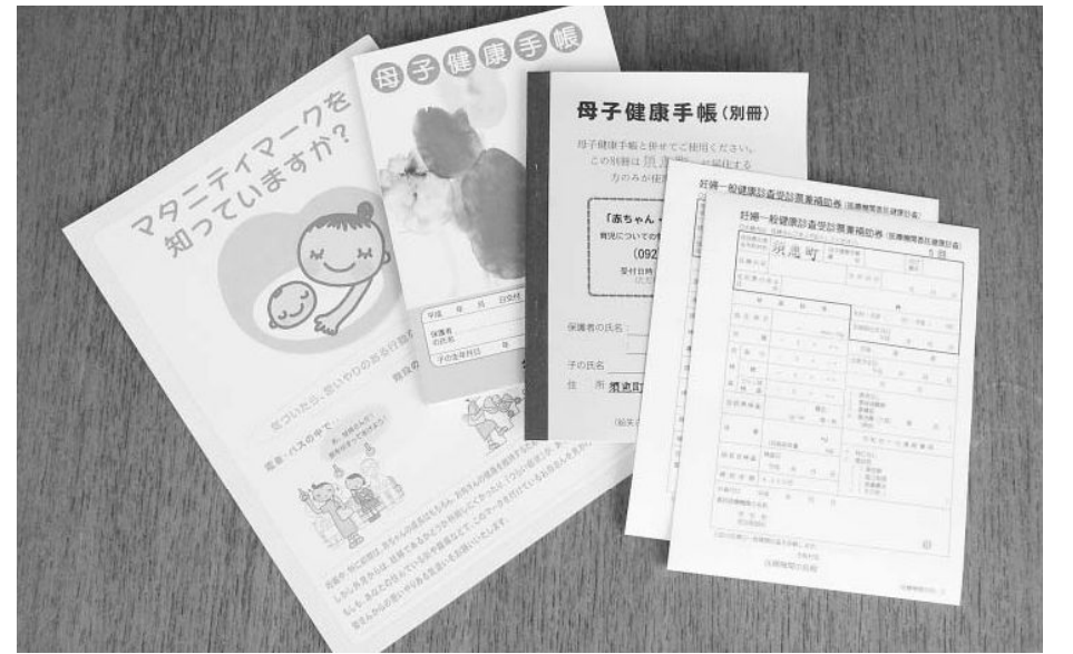
妊婦一般健康診査受診券等

現在は2回の助成を行っています。少子化は国の存亡にかかる大事な問題であり、本来は国が行うべき事業であろうと思っておりますが、国からは何の補償もないのが実情です。 しかし、先取りした形でやっていった方が良いのではという気持ちを持っています。 次の市町長会で最終的に決定すると思っております。