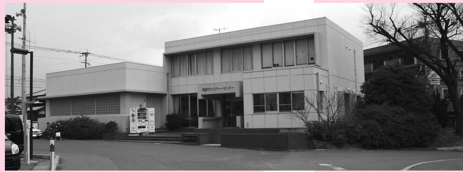
緊急保証制度の窓口になっている「須恵町商工会」

なったもので、業種の拡大もあっています。従来のセーフティネット保証制度の時、須恵町では68件、宇美町が78件、志免町が57件、粕屋町が69件、県全体としては、1万5157件の申請の申出があつていますが町としても申請が