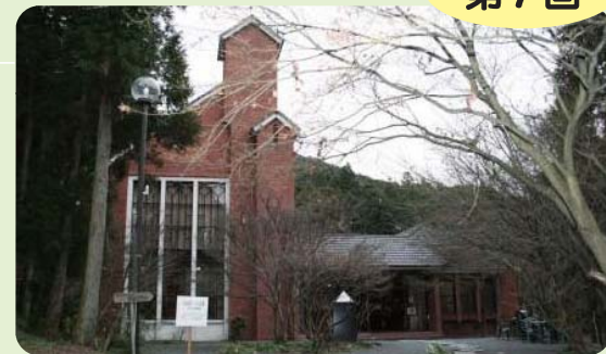
須恵町立美術センター「久我記念館」

須恵町の施設・各種団体、サークルなどを訪問します。 今回は、須恵町立美術センター「久我記念館」にごめんなざっしえ〜!(ごめんなさい)