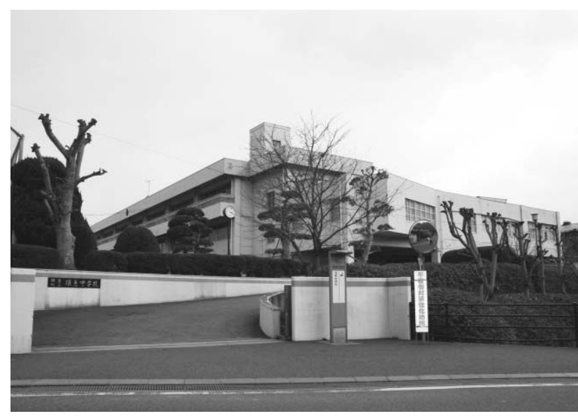
耐震診断が行われる「須恵中学校」

漏水事故を補償 水道事業会計(第2回)◇ 収益的支出予定額に407万8000円を追加し、総額が6億3305万円となりました。 これは、職員の異動に伴う人件費と平成6年に発生した漏水事故による補償費です。 (全員賛成で可決) 3軒の家屋に被害をもたらし、うち2軒については補償が完了していましたが、残る1件については、引き続き調査を行うようになっていたもので、平成20年10月に示談が成立したため補償をするものです。