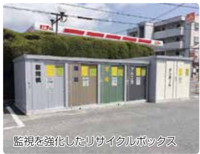
監視を強化したリサイクルボックス