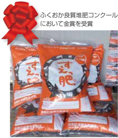
ふくおか良質堆肥コンクールにおいて金賞を受賞

A すえつ肥は、人気があり、売れ行きが良いと聞いている。また、コンクールで入賞するなど、とても良いものを作っているのに、堆肥センターは、ストックヤードのブロック塀および屋根が破損し、危険度が高い。修繕を行うべきではないか？