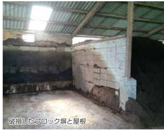
破損したブロック塀と屋根