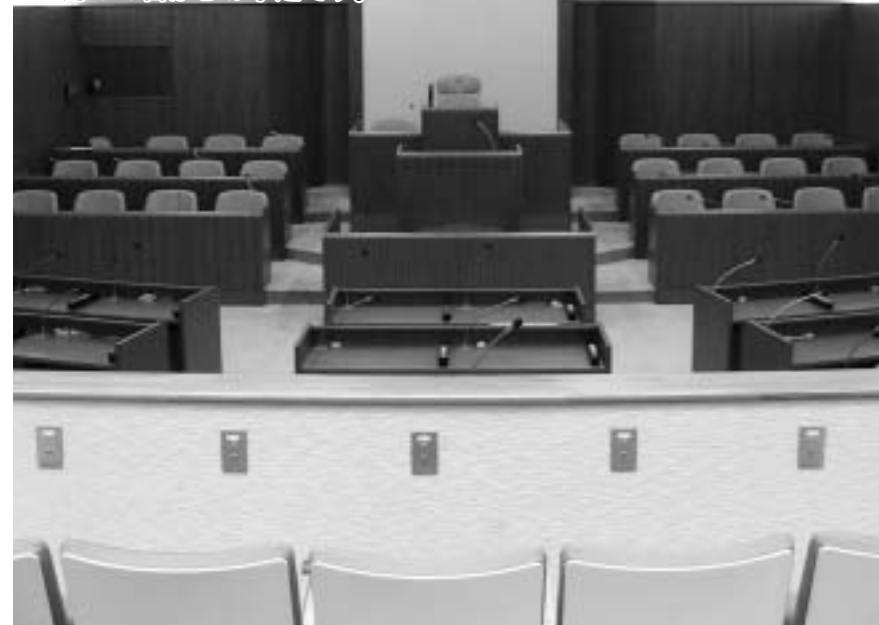
傍聴席から見た議場