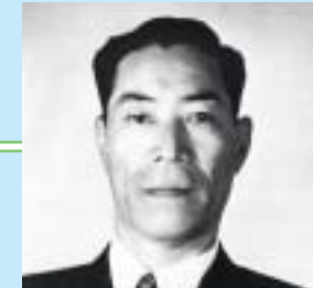
第5・6代議長 瓦田 鼎二郎氏 (S34.5~S42.4)