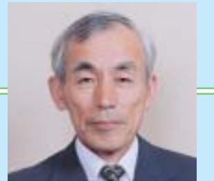
第15代議長 今泉 元行氏 (H11.5~H15.4)