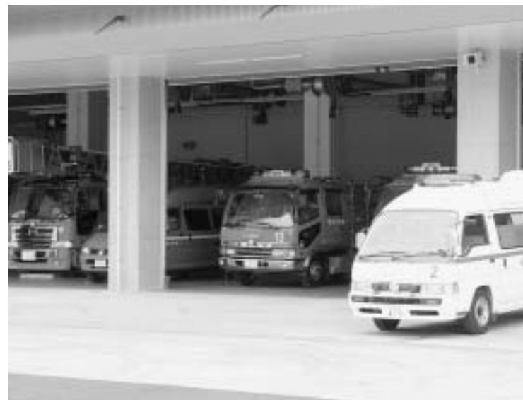
粕屋南部消防組合 “南部消防署”