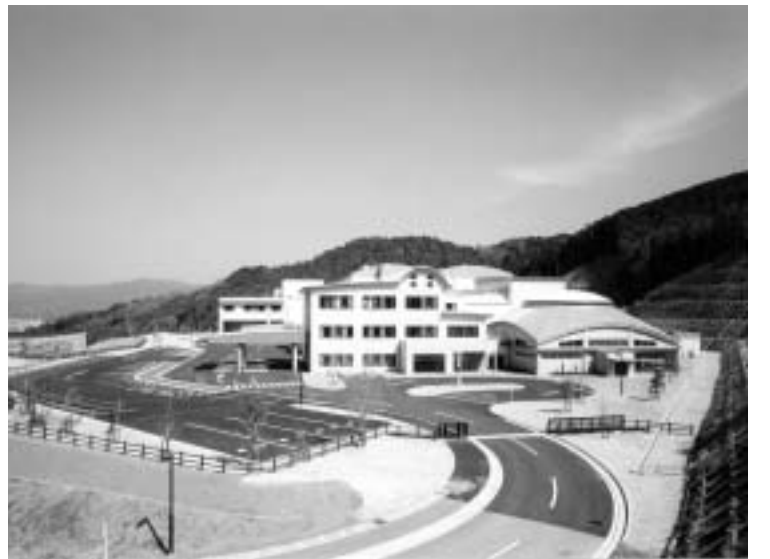
須恵町外二ヶ町清掃施設組合 “クリーンパークわかすぎ”

「組合議会議員」 二つ以上の団体が、 事務を共同で処理す ることによって経済 的、能率的な効果が 得られる一部事務組 合の議会議員です。