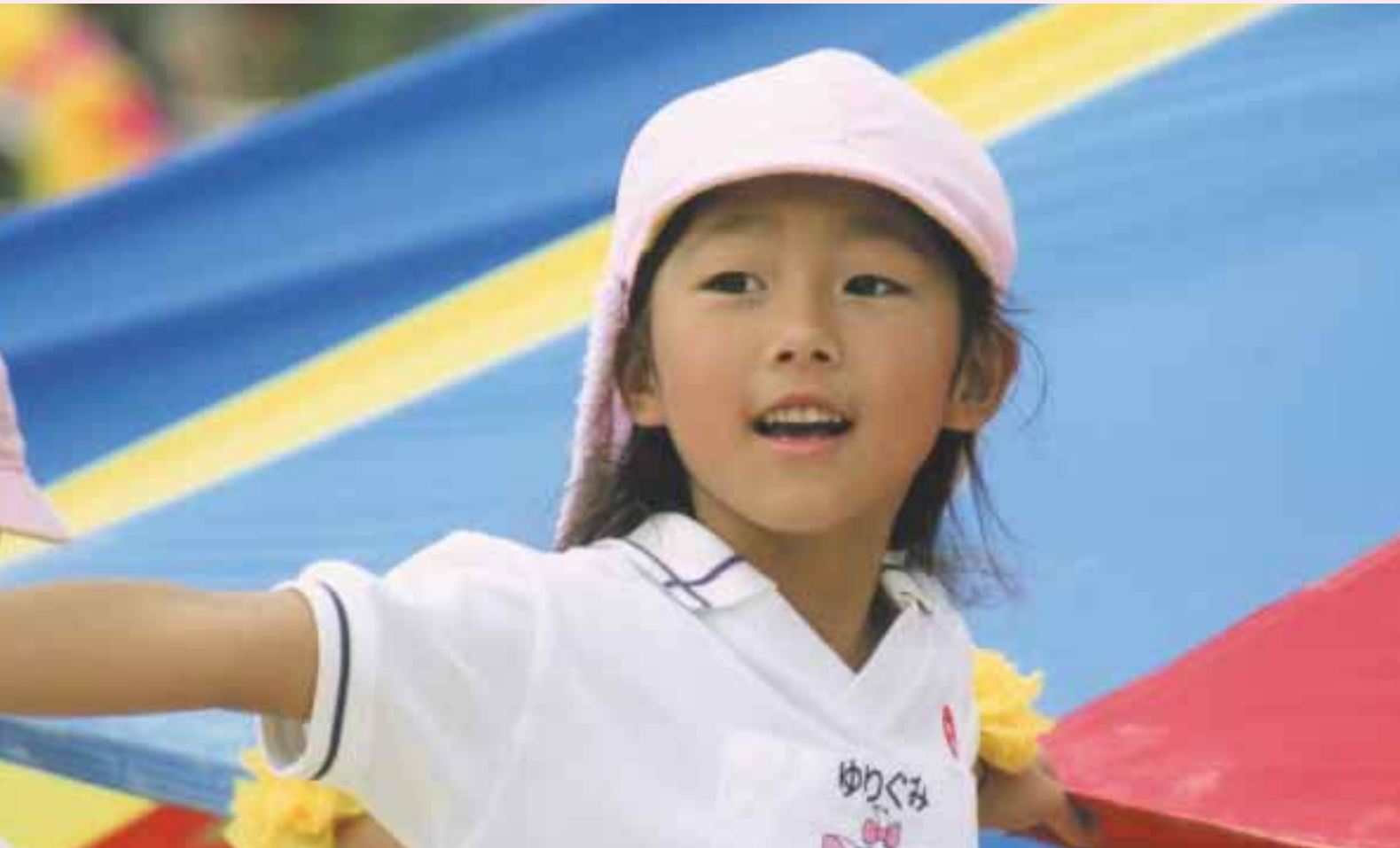
「輝きながら」(町立南幼稚園運動会)