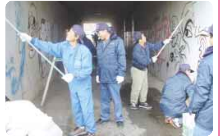
落書き消し作業中の青少年指導員会

名前のとおり唐辛子は唐(中国)より伝わった辛子という意味で、胡椒も胡(中国の民族)より伝来したものです。