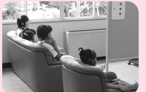
ビデオを館内視聴することもたち