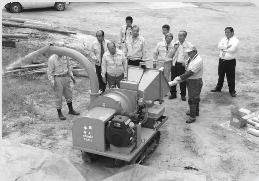
樹木粉碎機の説明を受ける建設産業委員会