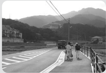
道路改良される内原～大谷線

西原～酒殿線 道路改良工事 本路線は、都市計画道路整備として一昨年度より用地取得に取りかかり、今年度は三ヶ年工事の最終年度にあたります。工事量について、工事長三四七・五メートル、工事は大きく分けて土木本体工事、信号機設置工事、照明灯設置工事、附帯工事が予定されています。事業費は、一億一千二百万円、財源内訳として、国庫補助金三千八百五十万円、一般財源七千三百五十万円です。