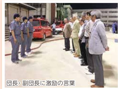
団長・副団長に激励の言葉