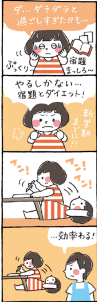
作・田原ウーゴ No.37 1979年須恵町生まれ。イラストレーターとして福岡を中心に九州・東京の広告やエディトリアルにて活動中。 http://polyworks.jp