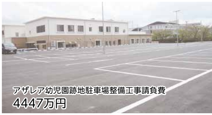
アザレア幼児園跡地駐車場整備工事請負費 4447万円