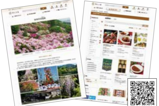
ふるさと納税サイト『さとふる』にも掲載