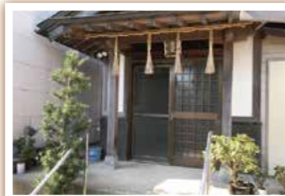
階段をのぼったところにお堂があります。