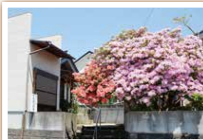
春には見事なツツジが咲きます。