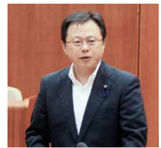
田ノ上 真 議員