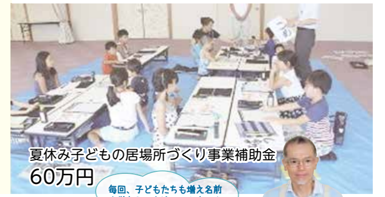
夏休み子どもの居場所づくり事業補助金 60万円

毎回、子どもたちも増え名前を覚えるのも追いつきませんが、子どもたちの笑顔とパワーが私の活力になっています。