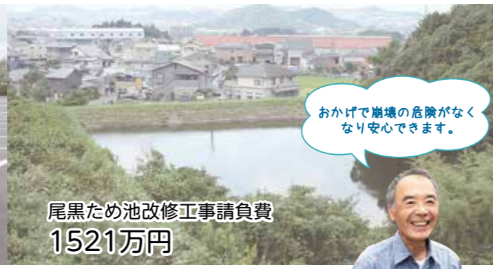
尾黒ため池改修工事請負費 1521万円