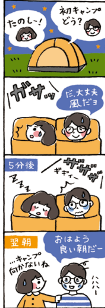
作・田原ウーコ No.38 1979年須恵町生まれ、イラストレーターとして福岡を中心に九州・東京の広告やエディトリアルにて活動中。 http://polyworks.jp