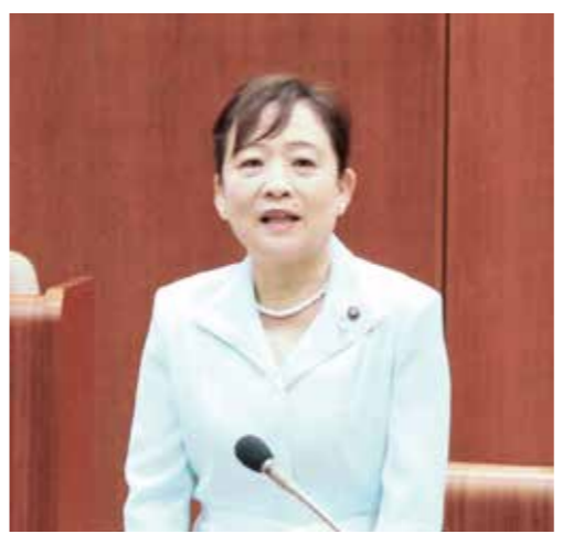
今村 桂子 議員

の対策・支援についてお答えください。 例えば、企業に対して消防団協力事業所表示制度導入の検討、学生に対して就職活動の推薦状、学生消防団員に奨学金の支給、女性消防団員の加入促進、退職消防団員による大規模災害時限定の機能別分団の創設等の推進についてのお考えは。