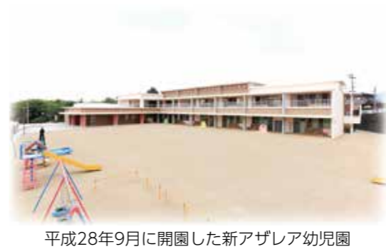
平成28年9月に開園した新アザレア幼稚園

Q まちづくり課長 現在のところ、従来通りの形態で運行する予定。10月1日から、①正信会水戸病院前、②Aコープ須恵店前のバス停を追加し、路線の変更を実施する。