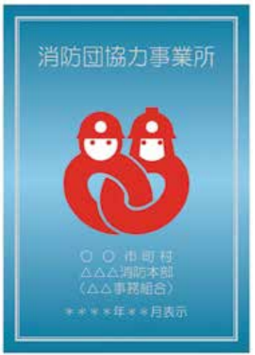
消防団協力事業所表示証(サンプル)

に対する奨学金支給は、他の団員との公平性から考えていませんが、就職活動のための推薦状は、他自治体の実例や動向など、情報収集をしたいと思えます。 女性消防団員は多岐にわたる活動の場がありますが、実際の火災現場では、後方支援がメインになっていると聞いています。須恵町では女性消防団員は在籍していませんが、まずは、役場庁舎の女性職員(約40人)が、大規模災害発生時など有事の際に、災害対策本部で後方支援活動を行う体制を考えていきたいと思っています。 自衛消防組織要員は、消防団への加入よりも組織内での活躍を期待しています。