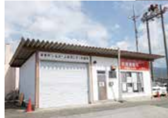
現在の作業所（須恵交番よこ）