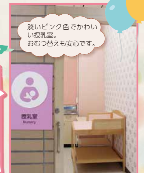
淡いピンク色でかわいい授乳室。 おむつ替えも安心です。