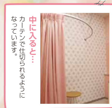
中に入ると... カーテンで仕切られるようになっています。