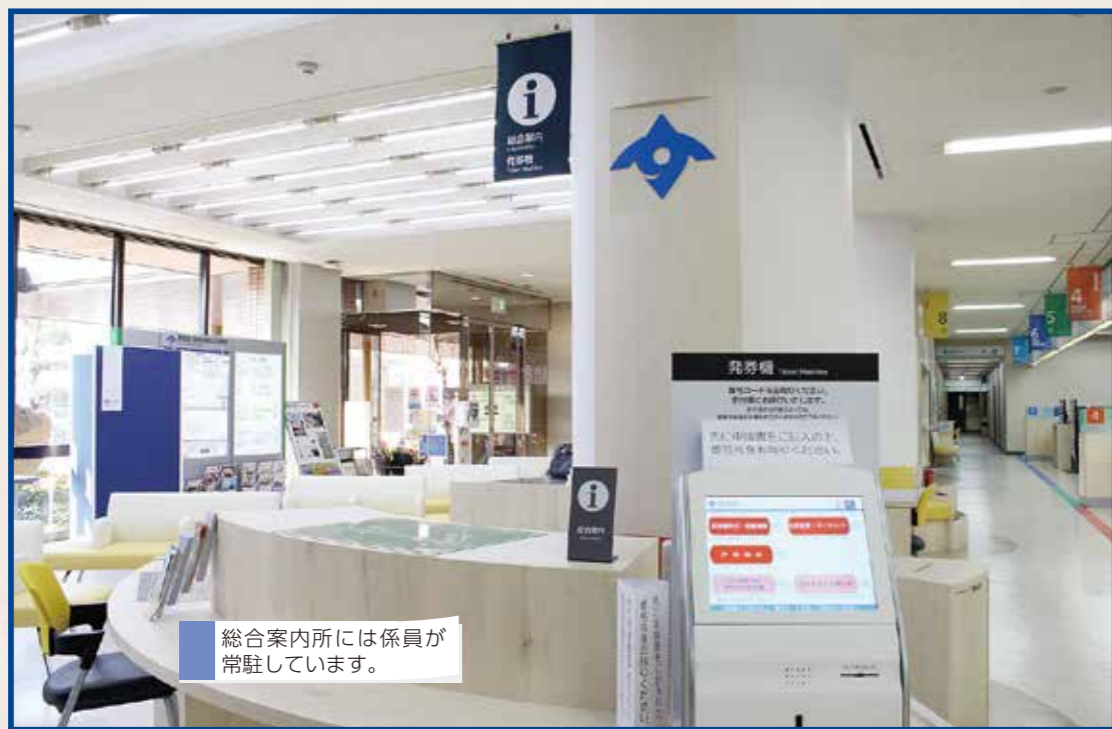
総合案内所には係員が常駐しています。