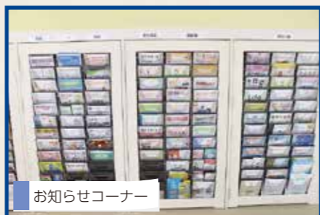
お知らせコーナー