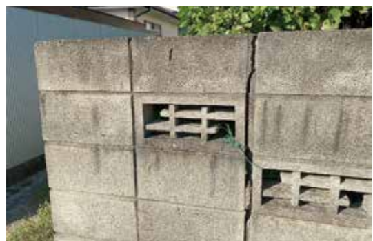
ひびが入ったブロック塀