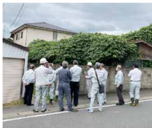
植物に覆われた家屋

議会が設置され、さっそく対策が進められています。また、本年7月および8月に開かれた臨時会では、近隣に影響を及ぼし、さらに被害が拡大する恐れが高く、所有者による管理ができない空き家に対し、無償で当該土地の寄附を受け、解体手続きに踏み切るための財産の取得議案、またそれにもなう解体予算が提出され、可決しました。町として、長引く空き家問題を解決し、住民の安心安全というゴールに向かうためスタートをきり、一歩ずつ進み始めています。