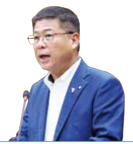
答弁中の平松町長