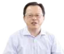
田ノ上 真 議員