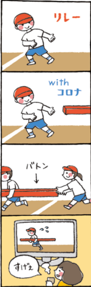
作・田原ウーコ 1979年須恵町生まれ。イラストレーターとして福岡を中心に九州・東京の広告やエディトリアルにて活動中。 http://polyworks.jp