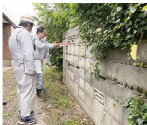
倒壊のおそれがあるブロック塀

町の空家等対策協議会が進める施策が、よりよいものとなるよう知恵を出し、支援していきたいと思います。現場の最前線で、様々な対応に苦慮されている担当課の頑張りにエールを送ります。