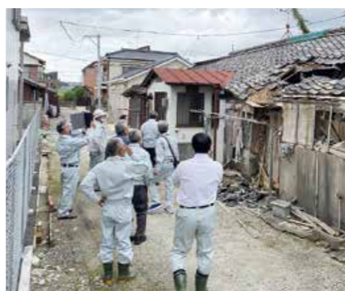
屋根が崩落した家屋