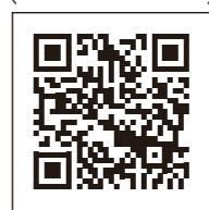
須恵町ホームページ