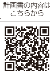
須恵町ホームページ

※男女共同参画社会とは、男女が個人として尊重され、性別に関わりなく自己の能力を自らの意思に基づいて発揮でき、あらゆる分野に対等な立場で参画し、ともに責任を負う社会です。