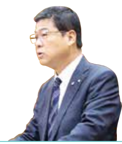
答弁中の平松町長