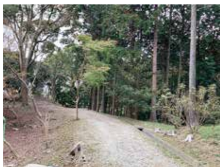
久我記念館から見た景観