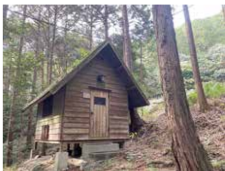
かつて使われていたバンガロー

教育や校区コミュニティ事業の場としてのキャンプ場再活用のご提案ですが、くらしのコミュニティ構想の中で、各コミュニティのまちおこし分野があり、そこで協議していくことは可能だと思います。 まちづくりは、町が主導して行うものではありません。キャンプ場問題を一つのテ