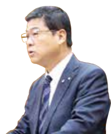
答弁中の平松町長