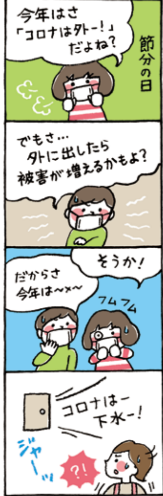
作・田原ウーコ 1979年須恵町生まれ。イラストレーターとして福岡を中心に九州・東京の広告やエディトリアルにて活動中。 http://polyworks.jp