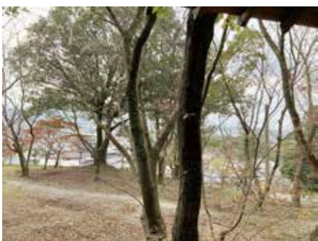
東屋から見た景観