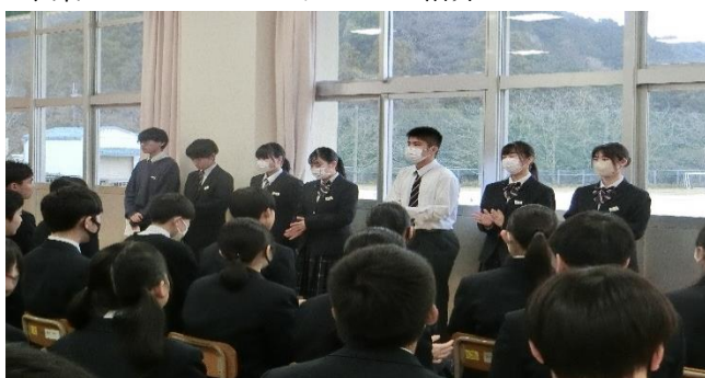
卒業プロジェクト・リーダー紹介