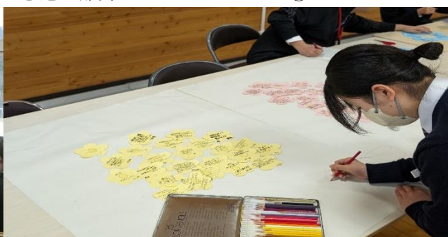
恩返し部会・メッセージづくり①