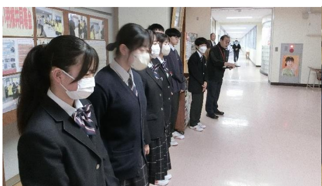
恩返し部会・挨拶運動