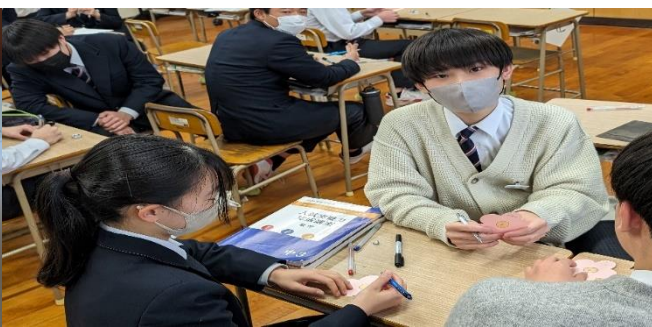
恩返し部会・メッセージづくり②