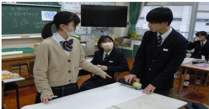
学級活動部会の活動