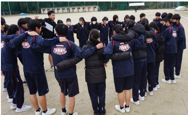
クラスマッチの様子①