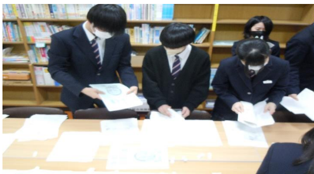
卒業文集部会の活動