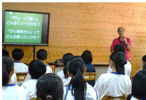
多目的室にて講師の話を聞く様子

現在、2 人に 1 人がかかるといわれる「がん」という病気について、正しい知識、がん予防やがん検診の重要性、そして、命の大切さについて、真剣に話を聞いている姿が見られました。