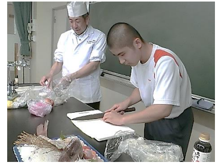
大和青藍高校 調理科の授業