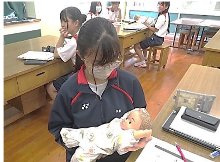
博多高校 普通科保育クラスの授業