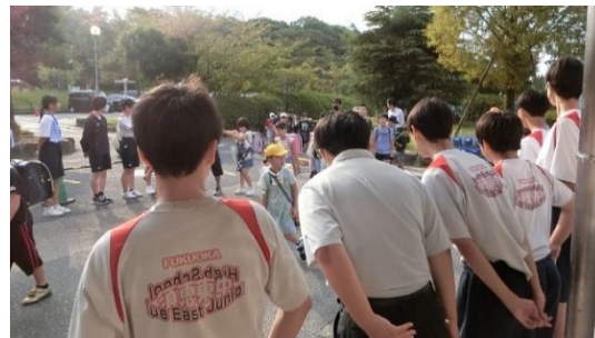
第二小学校で挨拶をしている様子