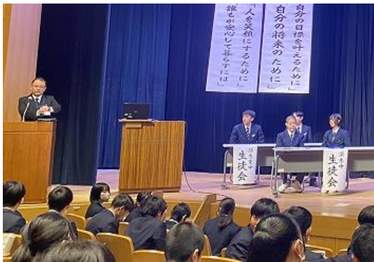
式典の会場(アザレアホール)

また、第二部に行われた座談会「ここがすごいよ、我が学校、我が須恵町」では、生徒会役員2名が、東中のよさをプレゼンにて発表しました。特に、校則を生徒自ら考えて見直したことについては、須恵中学校の生徒から質問され、回答する姿が誇らしく思えました。4人とも素晴らしい発表で、とても凛々しい姿でした。また、式典に参加した2年生は皆、話を聞く態度がよく、とても感心しました。