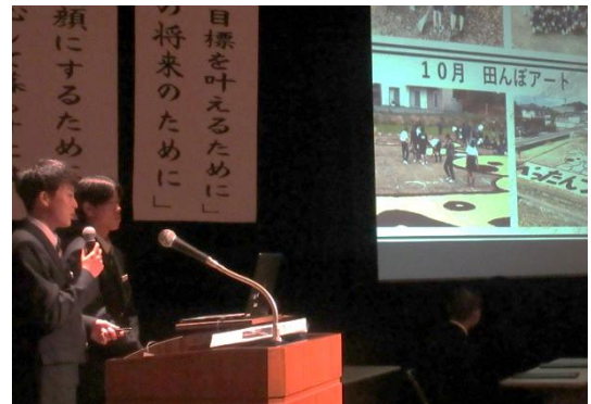
我が校の自慢をする生徒会役員