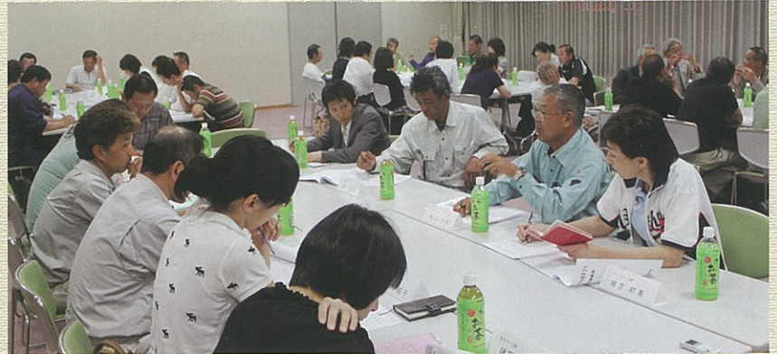
すこやかコミュニティ会議の様子