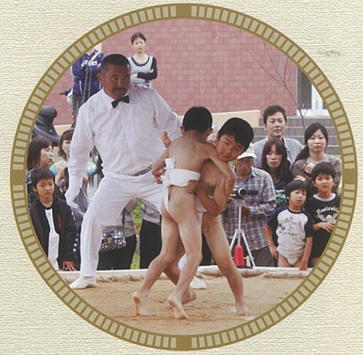
のこった!のこった!!

相撲大会が6月13日(日)に須恵第一小学校の土俵で開催されました。 団体戦・個人戦(学年別)で熱戦が繰り広げられました。