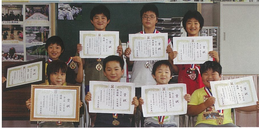
ほくたち頑張りました!