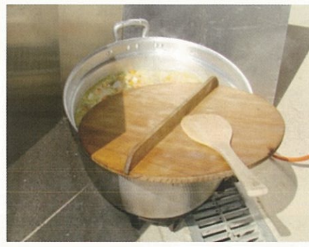
100人分の豚汁、みんなで作りました。