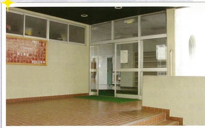
第二小学校・体育館入口から入って…