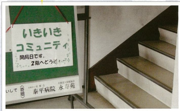
この看板を見て、階段で2階へ…