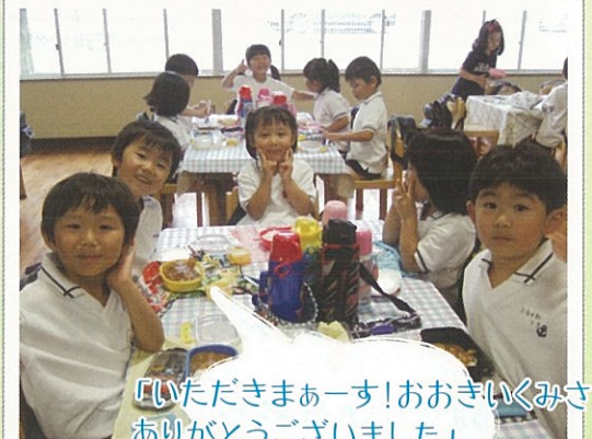
「いただきまーす!おおきくみさん ありがとうございました」