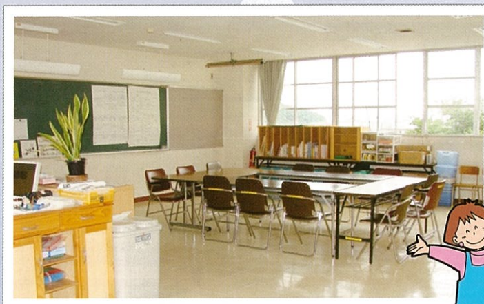
そこには…体育館の2階とは思えない、事務局あり!