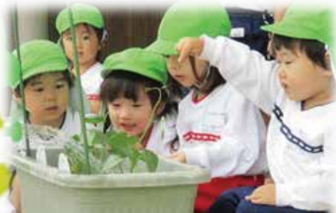
大きくなーれ!〜アサガオのお世話〜