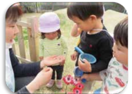
みてみて、ダンゴムシ