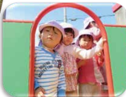
元気いっぱいの子どもたち