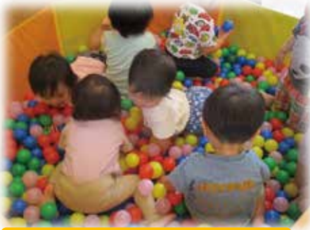
ボールプールでスーイスイ♪