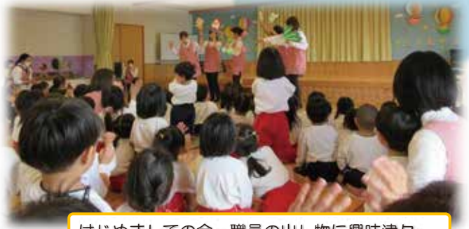
はじめましての会〜職員の出し物に興味津々〜