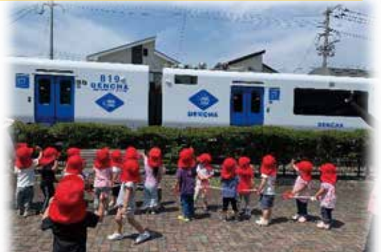
線路横の遊歩道はみんなの好きな散歩コース