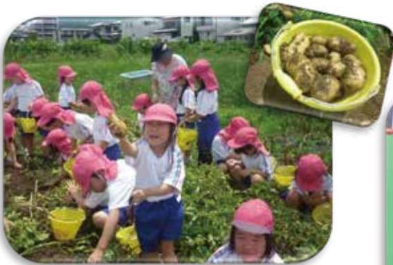
じゃがいもの収穫