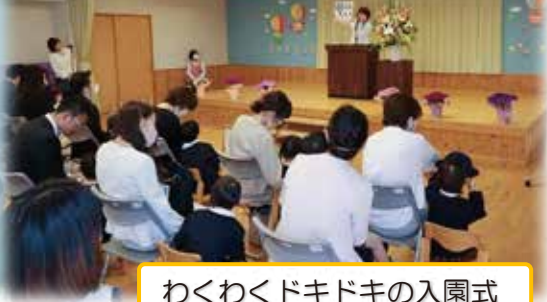
わくわくドキドキの入園式