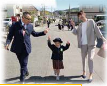
嬉しさが溢れてますね♪