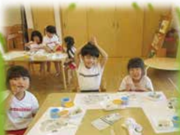
時の記念日にトトロの時計を作ったよ