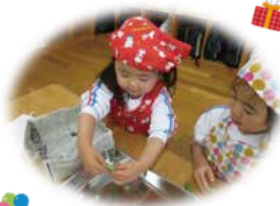
大好き！クッキング