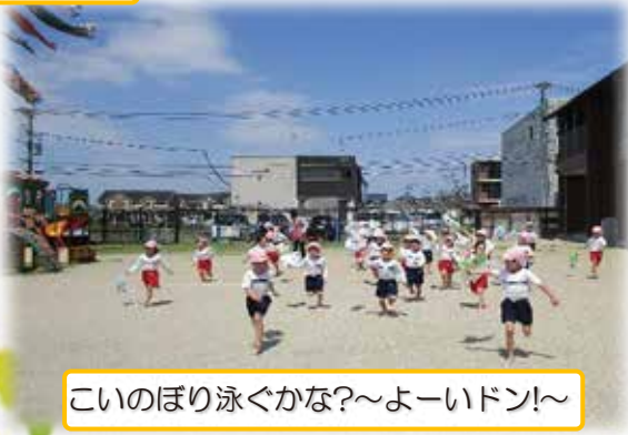
こいのぼり泳ぐかな?〜よーいドン!〜