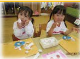
「見てみて〜!」粘土あそび