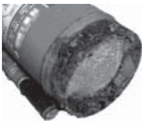
底が腐食している消火器

消火器内部には、圧縮された二酸化炭素ボンベが内蔵されています。消火器のレバーを握ると、ボンベが破られ、本体容器の内部に二酸化炭素が充満し、その圧力で薬剤が放出されます。その時に、消火器本体に腐蝕や変形があると、その部分が圧力に耐えられなくなり、破裂が起こります。消火器は日常的な管理が大変重要です。