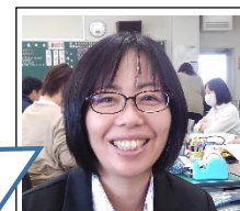
洞ノ上三貴子 4組担任 理科

---【私の Stay Home】----- スリザーリンクというパズルに親子ではまっています。脳活にもってこいです。でも、小学生の娘のほうが速く解けちゃうので悔しい思いをしています。